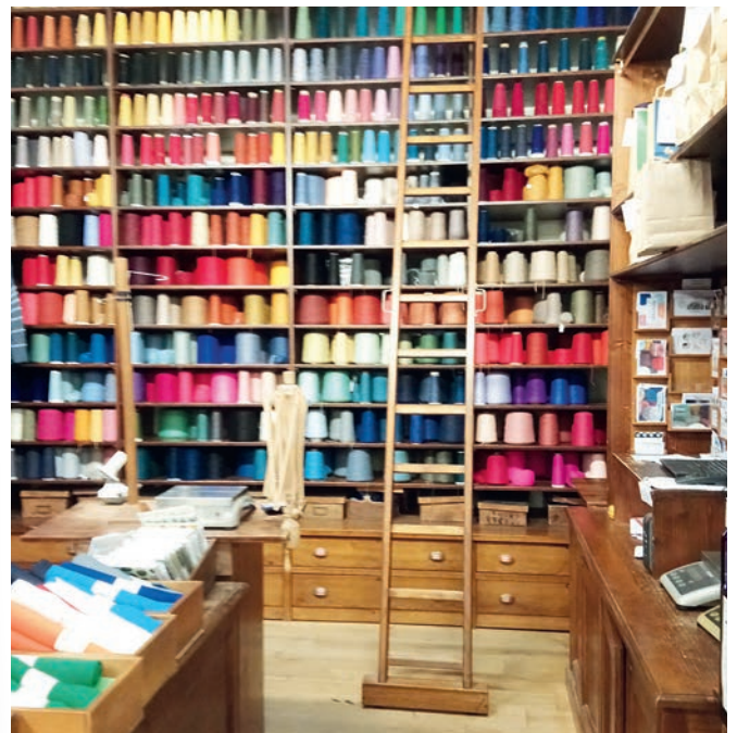
Intérieur de la Droguerie, rue du Jour, Paris 1 er